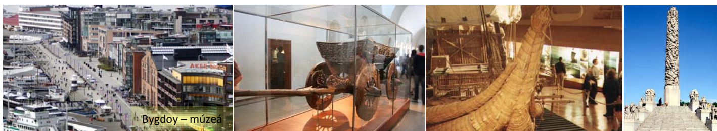
Bygdøy – múzeá

1. – 2.deň - NEDEĽA – PONDELOK 01.07. – 02.07.2012 - V skorých ranných hodinách odchod cez Poľsko a Nemecko do Sassnitz. Plavba do Trelleborgu a cesta pozdĺž pobrežia Švédska okolo Götteborgu. Príjazd do centra Osla – prechádzka modernou časťou Aker Brygge . Prehliadka známych múzeí na polostrove Bygdøy , návšteva Frogner parku so zbierkou unikátnych sôch sochára Gustava Vigelanda. Pevnosť Akershus, prechádzka pešou zónou okolo univerzity, parlamentu a iných pamätihodností. Ubytovanie + večera: Honefoss .